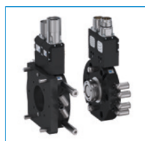
Výmenná jednotka robota