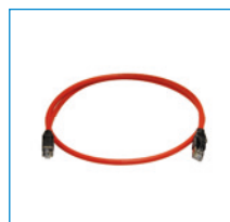
Adaptér Frekvenčný menič